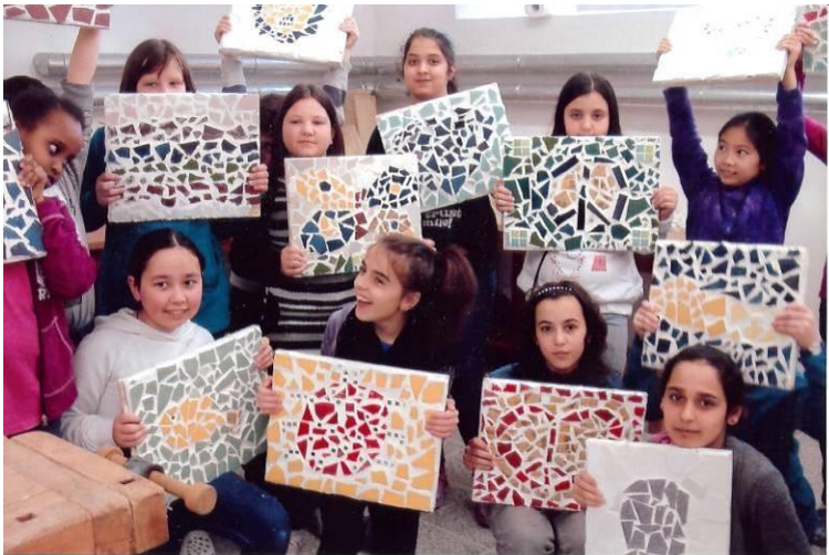
Vorarbeiten in der Schule