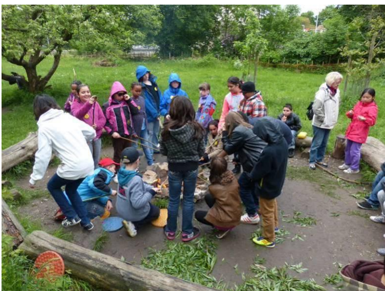
Abschlussfest mit Stockbrot