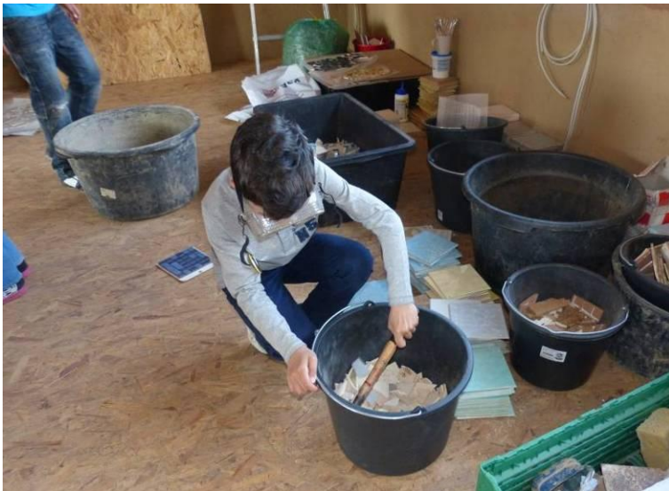
Erstellen der Fliesenscherben