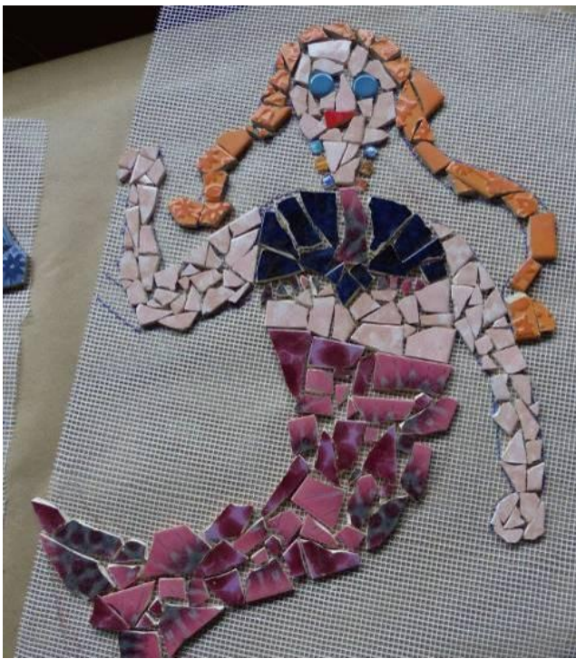
fertige Mosaik aufgezogen auf Gazestoff