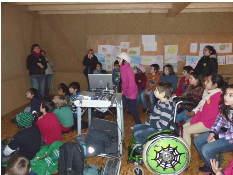
Kinderplenum im Gruppenhaus