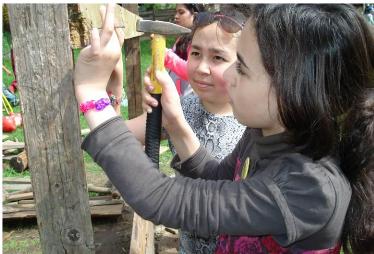
Arbeiten an der Hütte