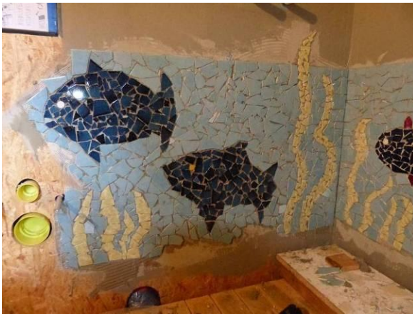
Erste Mosaik an der Wand des Toilettenraums